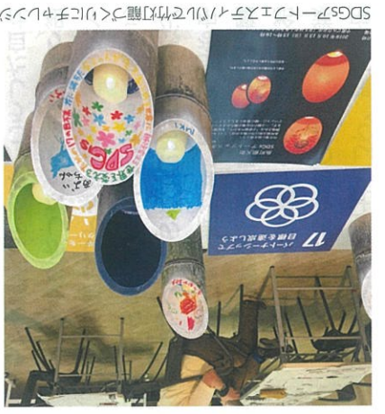
SDGsテーマのエコフレンドリーな竹灯籠づくりに参加

【特集】 「SDGs」の取り組みが、 企業にどのような影響を 与えているのか、その 取り組みの現状と今後の 展望について、本誌が 取材した。本誌が、 SDGsの取り組みが、 企業にどのような影響を 与えているのか、その 取り組みの現状と今後の 展望について、本誌が 取材した。